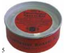
5 feuerfester Kesselkitt